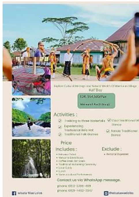
Gambar 3. Flyer Paket Half Day Tour Desa Waelolos