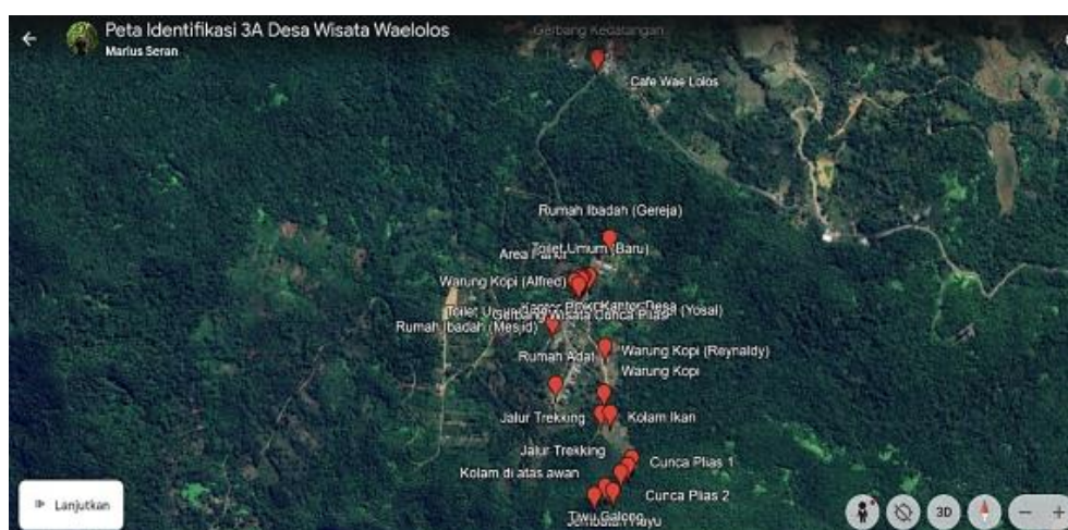
Gambar 2. Peta Identifikasi Aspek 4A Desa Wisata Waelolos

Desa Wisata Waelolos berjarak 32 Kilometer dari Labuan Bajo dan dikenal sebagai “Desa 1000 Air Terjun” karena adanya sejumlah air terjun yaitu Cunca Plias, Cunca Ri’I dan Kolam di atas Awan. Selain atraksi alam, desa ini juga kaya akan budaya lokal, termasuk rumah adat, tarian tradisional, dan budaya yang masih dipertahankan oleh masyarakat setempat. Pengembangan pariwisata di Desa Waelolos dijalankan oleh Pokdarwis Cunca Lolos. Pokdarwis ini diresmikan dan mulai berjalan sejak tahun 2023.