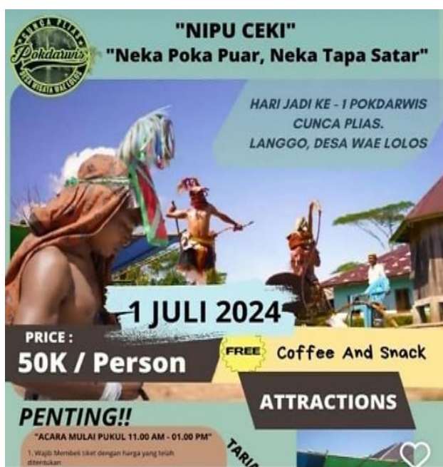
Gambar 5. Flyer Paket Special Event Desa Waelolos

Paket ini berdurasi kurang lebih 2 jam dengan sejumlah kegiatan utama yaitu pertunjukan budaya, interaksi sosial serta konsumsi pangan lokal hasil olahan masyarakat. Ciri kegiatan ini bersifat kilaomunal dan rekreatif karena mengundang partisipasi masyarakat dan wisatawan dalam satu aktivitas bersama-sama. Seluruh aktivitas juga mengandung nilai edukatif dan apresiasi terhadap budaya lokal.