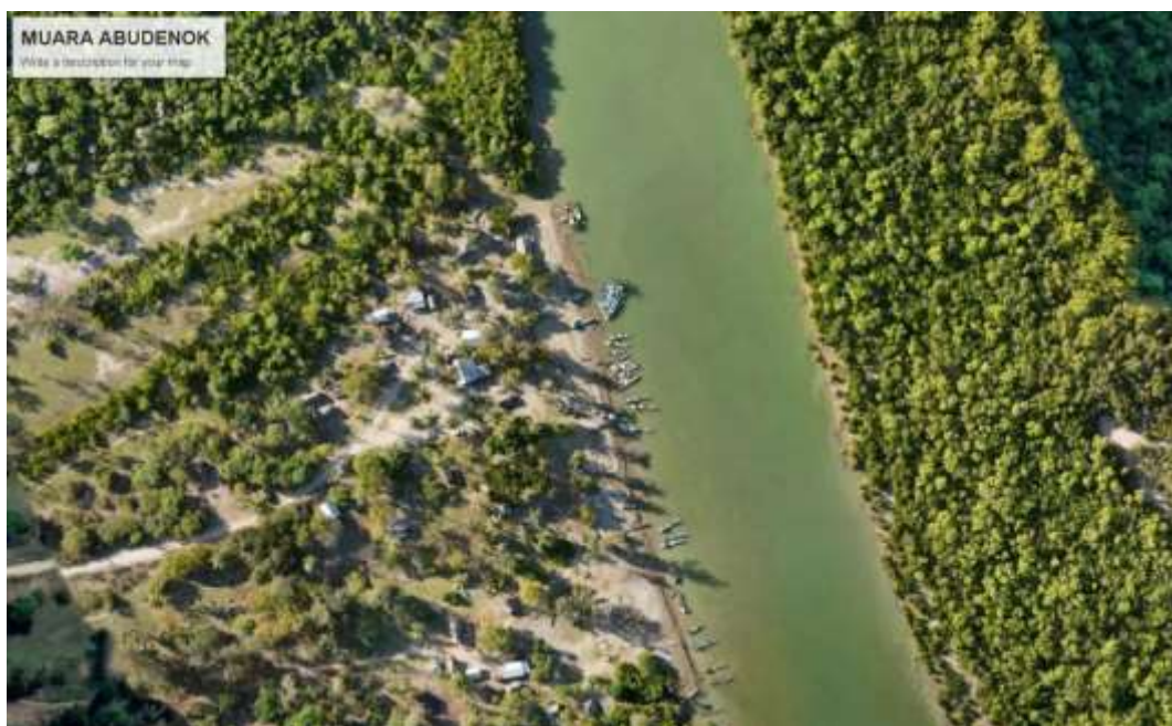
Gambar 3. Foto Udara Dusun Nelayan dan Ekosistem Mangrove di Muara Abudenok