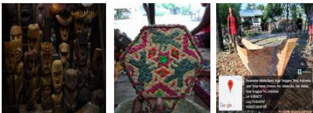
Gambar 4. Produk UMKM Patung, Anyaman dan Perahu Dayung Tradisional

Berbeda dengan produk patung dan pembuatan perahu tradisional yang sudah memiliki pasarnya masing-masing, persoalan promosi dan pemasaran dialami oleh para pengrajin tenun ikat dan anyaman. Berdasarkan wawancara yang dilakukan dengan Ibu Maria Hoar Morin dan Ibu Kornelia Hoar dapat disimpulkan bahwa kegiatan produksi tidak bisa dilakukan secara rutin karena kurangnya permintaan dan ketiadaan pasar (market) bagi mereka untuk menjual kerajinannya. Selain itu, hampir di semua desa juga memiliki produk tenun ikat dan anyaman yang serupa. Dengan demikian maka kegiatan pembuatan kain tenun ikat dan anyaman baru dilakukan pada saat ada pemesanan (order) atau setelah tenun ikat dan anyaman yang dibuat sebelumnya sudah terjual. Hal inilah yang menyebabkan para penenun dan pengrajin ini perlu mencari pekerjaan tambahan lain seperti berkebun atau berdagang, guna menunjang perekonomian mereka.