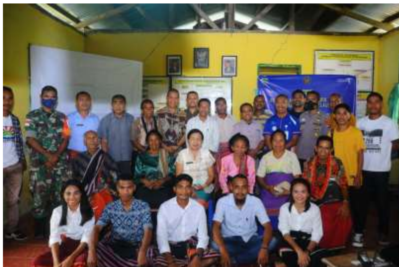
Gambar 5. Kegiatan FGD yang melibatkan pemangku kepentingan dari 5 unsur yaitu Pemerintah, Akademisi, Bisnis, Masyarakat dan Pers

Pertama , peningkatan kualitas akses jalan dan fasilitas publik. Peningkatan kualitas akses jalan dari kategori jalan tanah dan jalan pengerasan menuju ke jalan aspal sangat penting guna menunjang akseibilitas wisatawan yang berkunjung. Dengan menyediakan jalan beraspal maka semakin memudahkan mobilitas dan pergerakan manusia atau kendaraan untuk keluar masuk ke destinasi tersebut. Kedua , pembuatan PERDES yang berkaitan dengan pelestarian dan konservasi, zonasi dan pengelolaan pariwisata berbasis masyarakat. Dengan menyediakan payung hukum bagi seluruh perencanaan dan pengelolaan yang diambil maka serentak juga memberikan kepastian bagi segala bentuk aturan, tata tertib, norma yang berlaku, termasuk didalamnya larangan dan sanksi yang akan diberikan, bagi setiap orang yang melakukan pelanggaran. Dengan aturan juga maka ada perlindungan dalam setiap proses pengembangan termasuk dari segi bisnis dan investasi.