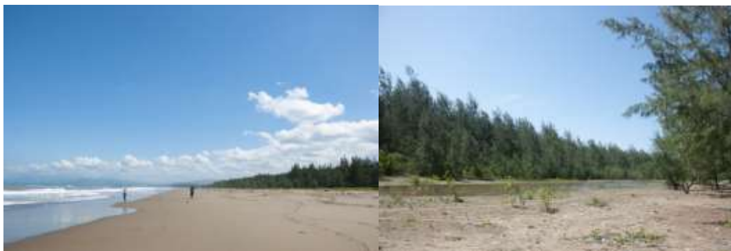
Gambar 2. Pantai Abudenok dan Hutan Cemara

Penelitian ini berlokasi di Desa Umatoos, Kecamatan Malaka Barat, Kabupaten Malaka. Batasan dari penelitian ini adalah atraksi wisata, amenitas dan akseibilitas yang ada di dalam wilayah Desa Umatoos. Pengembangan pariwisata berbasis masyarakat di Desa Umatoos sangat potensial untuk dikembangkan mengingat di desa ini terdapat sejumlah DTW yang cukup khas, unik dan tidak dapat dijumpai di wilayah sekitar. Salah satu destinasi yang dimaksud adalah muara Abudenok yang menjadi tempat bagi nelayan untuk tinggal dan melabuhkan perahunya. Sebagai desa yang berlokasi sepanjang aliran sungai benenai dan desa pesisir, potensi ini perlu dimaksimalkan tidak hanya untuk bidang perikanan dan kelautan, tetapi juga dapat dimanfaatkan untuk pengembangan pariwisata di daerah pesisir.