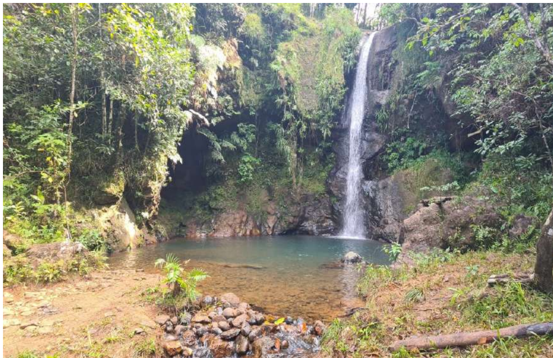
Gambar 3. Cunca Plias