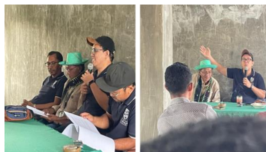
Gambar 1. Pelaksanaan Kegiatan PkM

Tahap evaluasi dilakukan melalui post-test yang terdiri atas tujuh pertanyaan berbasis studi kasus. Evaluasi ini bertujuan untuk mengukur pemahaman peserta terhadap materi yang telah disampaikan, khususnya dalam mengidentifikasi perilaku tidak pantas dan menentukan tindakan yang tepat dalam situasi pelayanan wisata.